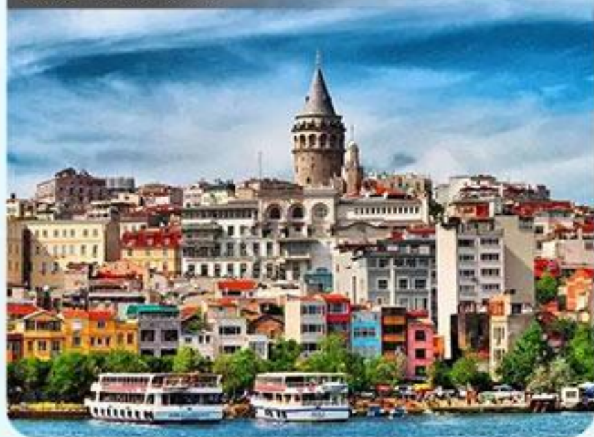
伊斯坦布尔老城区